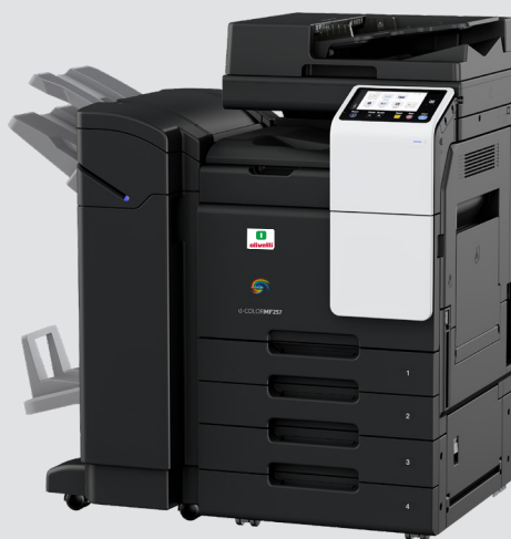
mit FS-539SD und PC-218