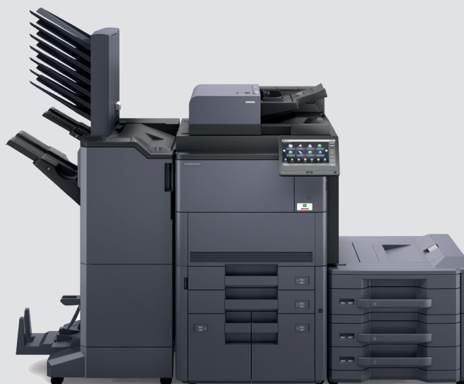
Configurazione con PF-730+PF-7130+DF-7110+MT-730+BF-730