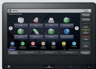
Pannello tattile a colori da 10,1", orientabile