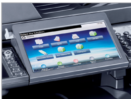
7 Zoll Color-Touch-Display in der Neigung verstellbar