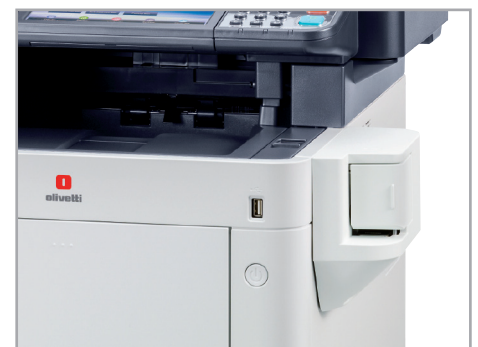
Halbautomatischer Hefter* für bis zu 20 Blatt