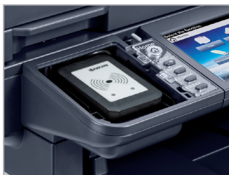
Magnetkartenleser* zur Authentifizierung