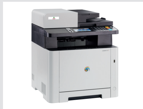
Design compatto ed elegante