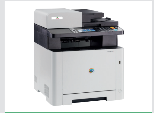
Kompaktes und elegantes Design