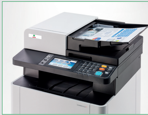
Originaleinzug mit Duplex-Scan