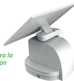
Cobertura para la integración con formPOS 600