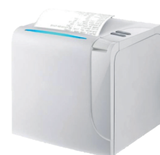
Puede colocarse verticalmente para la salida de papel desde arriba