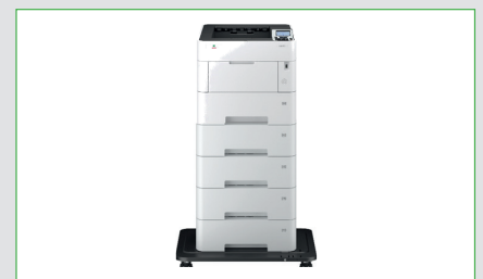
Konfiguration mit 4 PF3110 und Rollensatz