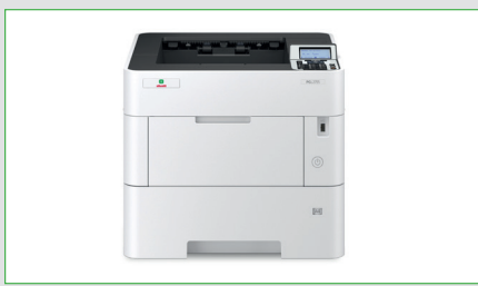
Kompakt und ansprechend